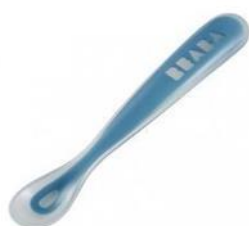
Cuchara inicial o hemisférica (plana, pequeña)

La cuchara hemisférica es la más adecuada para el uso inicial en lactantes pequeños, ya que este formato mostró estadísticamente menos confusión con respecto a la posición de los labios del lactante en relación a otros tipos de cucharas (ovalada y ensanchada ( p < 0.01 ) (152).