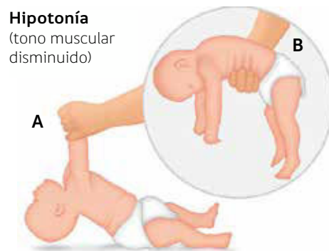
Figura 1. Maniobras para evaluar tono en recién nacidos y lactantes

A. Maniobra de tracción de extremidades.