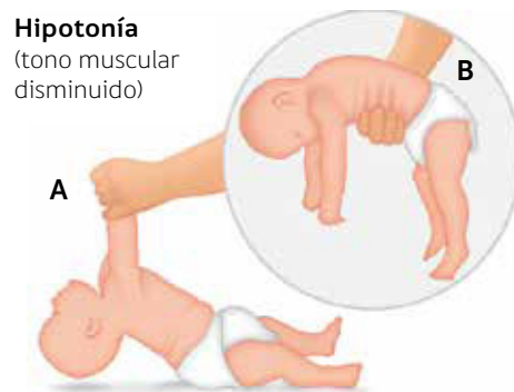
Figura 1. Maniobras para evaluar tono en recién nacidos y lactantes

A. Maniobra de tracción de extremidades. B. Maniobra de suspensión ventral en lactante, donde puede apreciarse el signo de la "U" invertida.